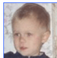
Серёжа Хронический миелобластный лейкоз