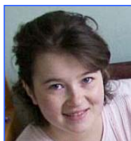
Оля Лимфобластный лейкоз